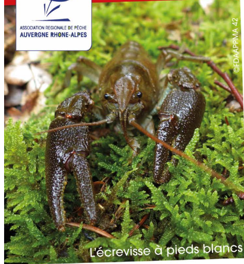
L'écrevisse à pieds blancs

PRÉFET DE LA RÉGION AUVERGNE- RHÔNE-ALPES Liberté Égalité