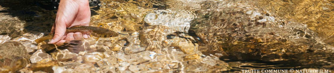
TRUITE COMMUNE