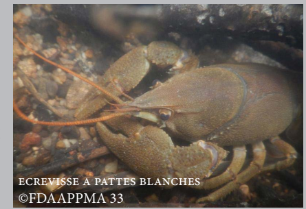
ÉCREVISSE À PATTES BLANCHES

Groupe de travail Listes Rouges Poissons & Ecrevisses