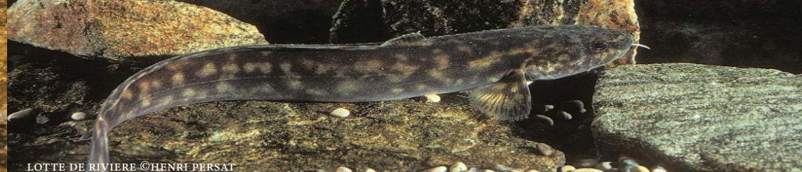
LOTTE DE RIVIERE