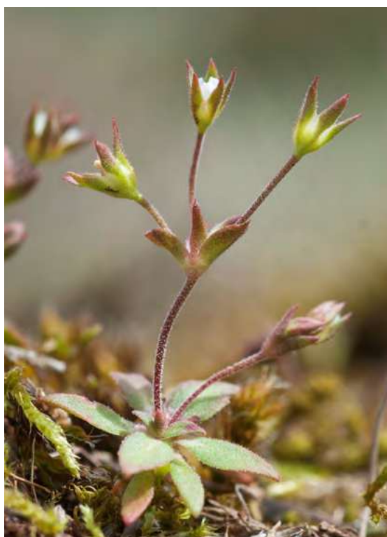
■ L'Androsace allongée ( Androsace elongata ), en déclin et classée "Vulnérable"