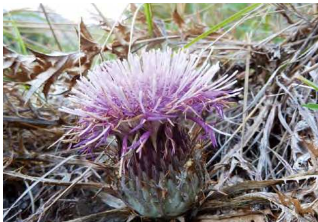
■ La Carline à gomme ( Carlina gummifera ), disparue de France métropolitaine

* X : espèce endémique de France métropolitaine.