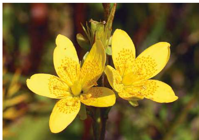
■ La Saxifrage œil-de-bouc ( Saxifraga hirculus ), une espèce "En danger critique"