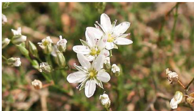
■ L'Alsine sétacée ( Minuartia setacea ), en déclin et classée dans la catégorie "En danger"

Les pressions touristiques telles que la surfréquentation et le piétinement intense affectent également des espèces comme l'Astragale de Marseille, classée "En danger", ou la Nananthée minuscule, "Quasi menacée". Et des pratiques de loisirs comme l'escalade touchent des plantes de montagne telle que la Benoîte à fruits divers, classée "En danger critique".