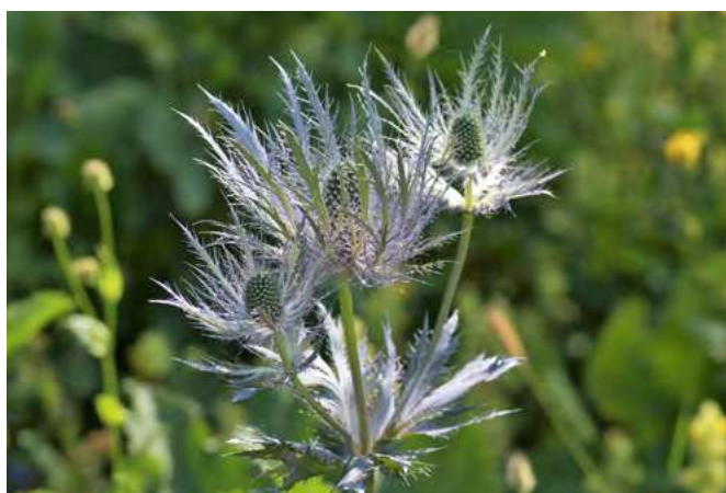
■ Le Panicaut des Alpes ( Eryngium alpinum ), en déclin et classé "Quasi menacé"

* X : espèce endémique de France métropolitaine.