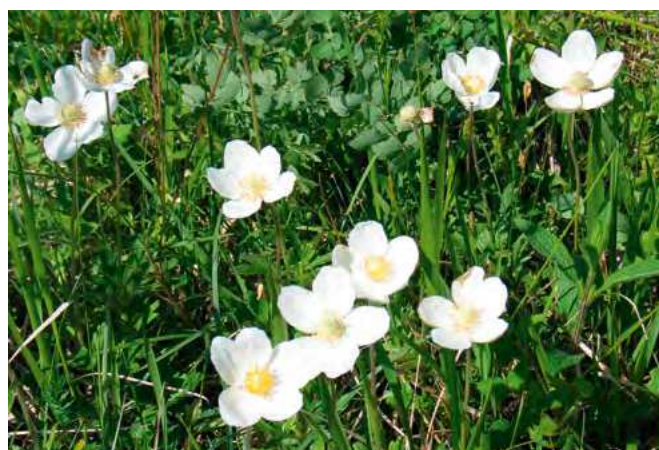
■ L'Anémone sauvage ( Anemone sylvestris ), classée en catégorie "Quasi menacée"