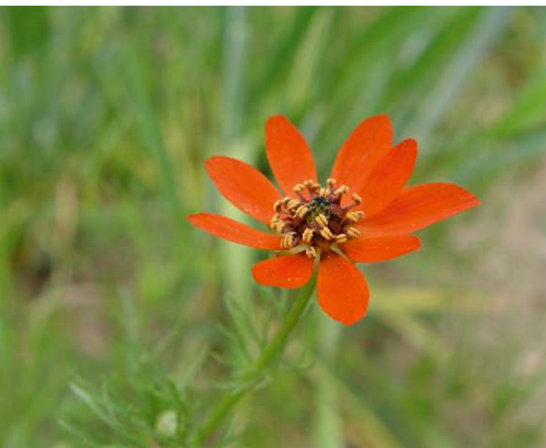
■ L'Adonis couleur de feu ( Adonis vernalis ), une espèce "Quasi menacée" et en déclin

L'état des lieux mené dans le cadre de la Liste rouge nationale a porté sur l'ensemble de la flore vasculaire du territoire métropolitain, afin de mesurer le degré de menace pesant sur chacune des espèces et sous-espèces.