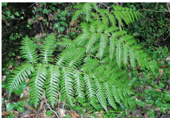
■ La fougère Woodwardia radicans ( Woodwardia radicans ), classée "En danger"