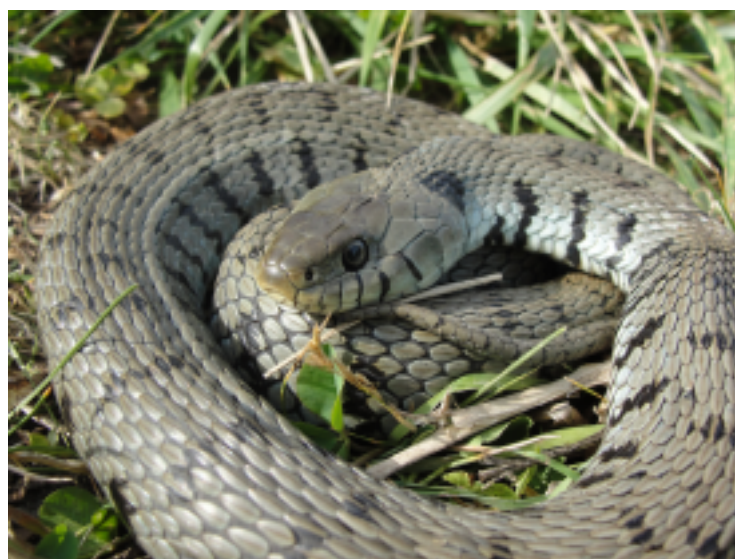
Couleuvre à collier