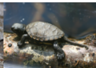
Cistude d'Europe © R. Quesada