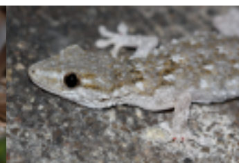
Tarente de Maurétanie