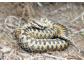
Vipère péliade