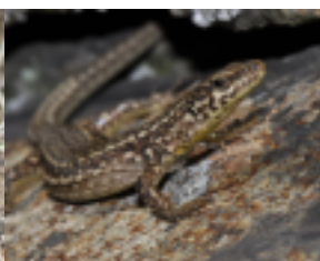
Lézard catalan